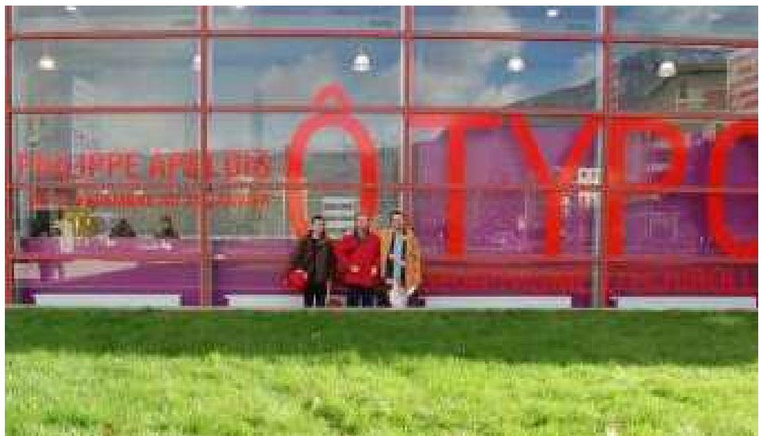
Representación española en 'le mois du graphisme d'Echirrolles', en Francia.

El centro del grafismo de la villa francesa de Echirrolles ( www.graphisme-echirrolles.com , www.teaching-design.com , www.ville-echirrolles.fr ) organiza desde noviembre hasta enero una serie de acontecimientos y exposiciones relacionadas con el mundo del diseño gráfico y de la comunicación visual, con muestras tan significativas como 'Caractères sportifs' (la escritura como ventana abierta sobre la civilización china), 'We love books!-A world tour' (una panorámica internacional sobre la producción mundial contemporánea), 'Livres d'artistes' (piezas importantes de las bibliotecas de la villa de Echirrolles), 'Ó typó' (el universo tipográfico de Philippe Apeloig a través de carte-