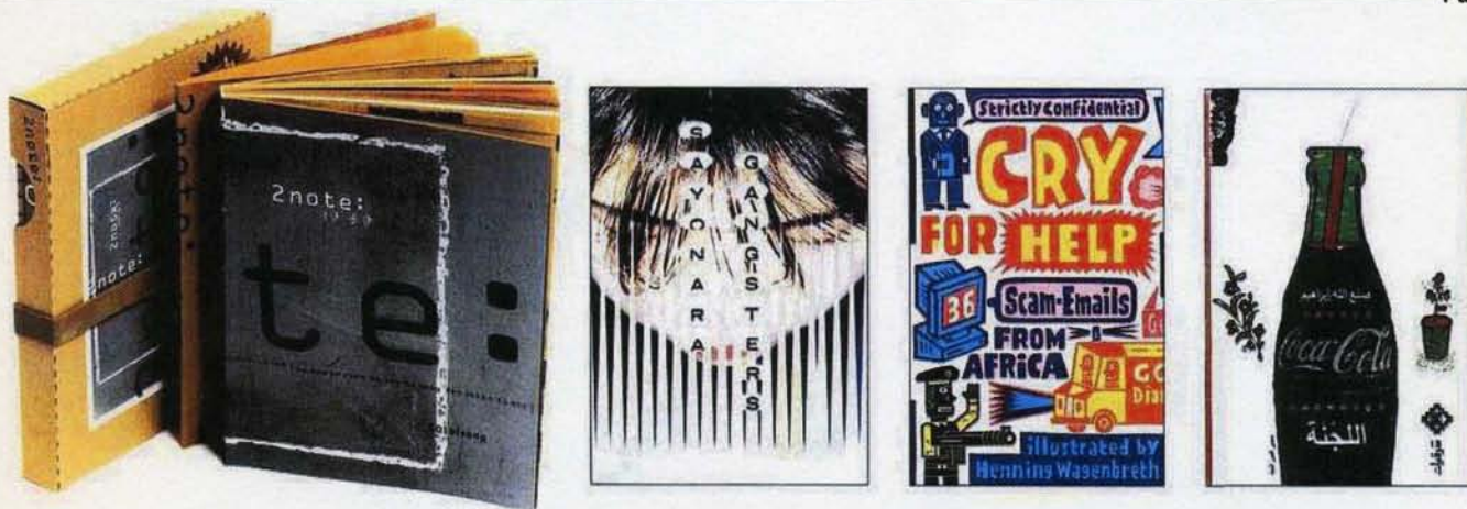
Ci-dessus de gauche à droite: Znote: time.space , par Park Kum-jun (Séoul), éd. Jong-in Jung • Sayonara Gangsters , par Chip Kidd (New York), éd. Vertical Cry for Help - 36 Scam E-mails from Africa , par Henning Wagenbreth (Berlin), éd. Gingko Press • Le Comité , par Mohieddine Ellabadi (Le Caire), éd. Sharqiyat

On est frappé par la richesse de la production mondiale. Avez-vous distingué des particularismes nationaux ou continentaux ?